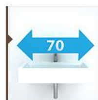
Подвесные 70 см