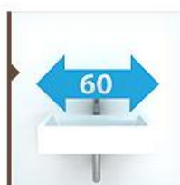
Подвесные 60 см