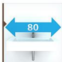
Подвесные 80 см