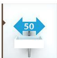
Подвесные 50 см