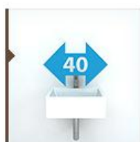
Подвесные 40 см