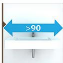
Подвесные 90 см и шире